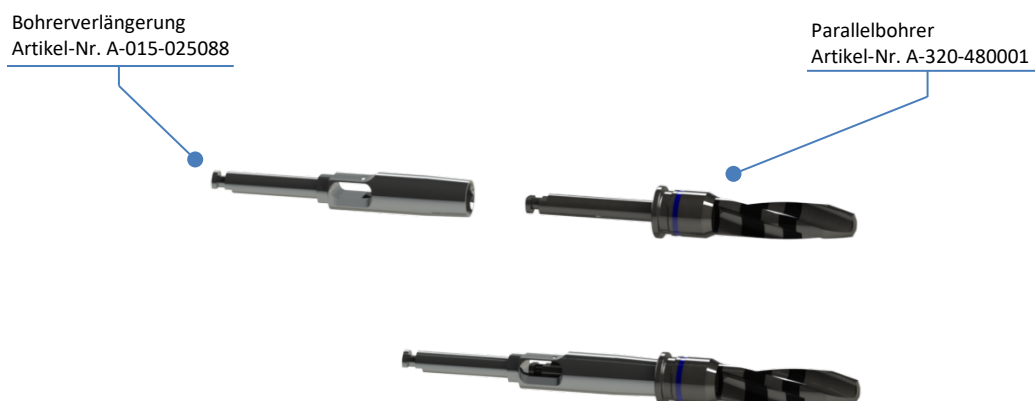
Zusammenbringen der Bohrererlängerung mit dem Parallelbohrer

Kombinierbar mit Bohrererlängerung Artikel-Nr. A-015-025088