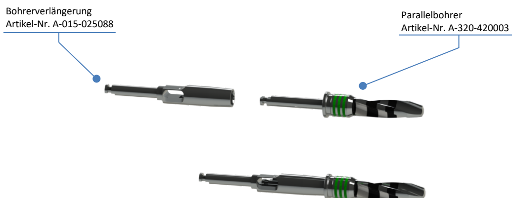
Zusammenbringen der Bohrererlängerung mit dem Parallelbohrer

Kombinierbar mit Bohrererlängerung Artikel-Nr. A-015-025088