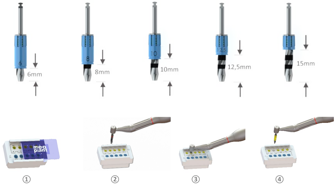
Tiefenstops Entnahme aus der Bohrstop-Box Artikel-Nr. S-250-290600

Kombinierbar mit Tiefenstops: Artikel-Nr. A-320-200060 bis A-320-200150