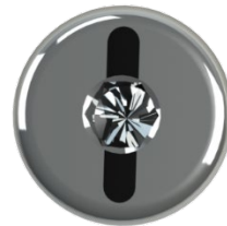
Draufsicht von okklusal